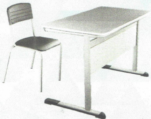
CJP01 - Conjunto Professor