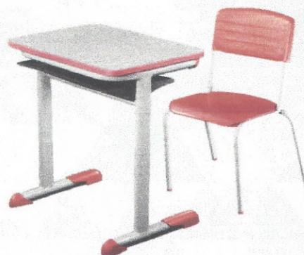
CJA04 - Conjunto Aluno