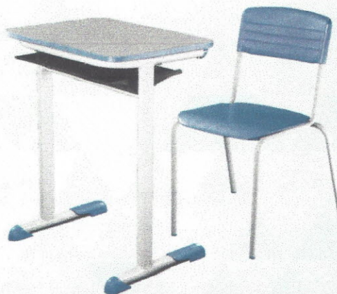
CJA06 - Conjunto Aluno