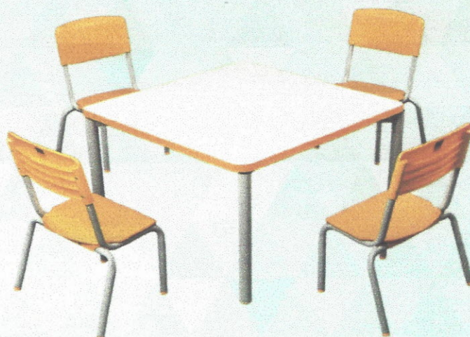
Conjunto Coletivo do Aluno