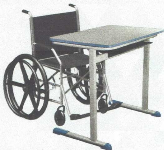
MA01 - Mesa Cadeirante