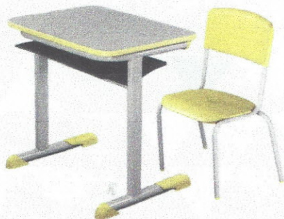
CJA03 - Conjunto Aluno