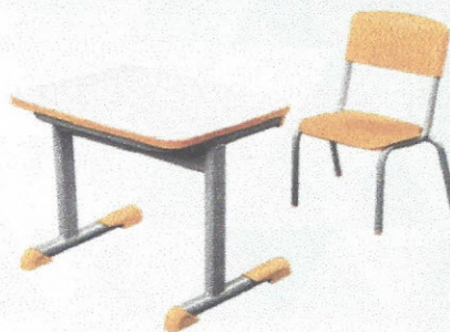
CJA01 - Conjunto Aluno