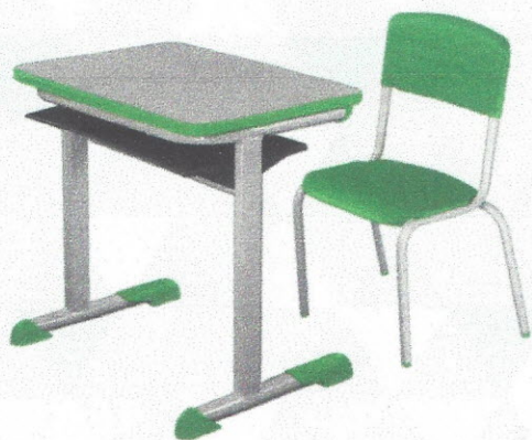
CJA05 - Conjunto Aluno